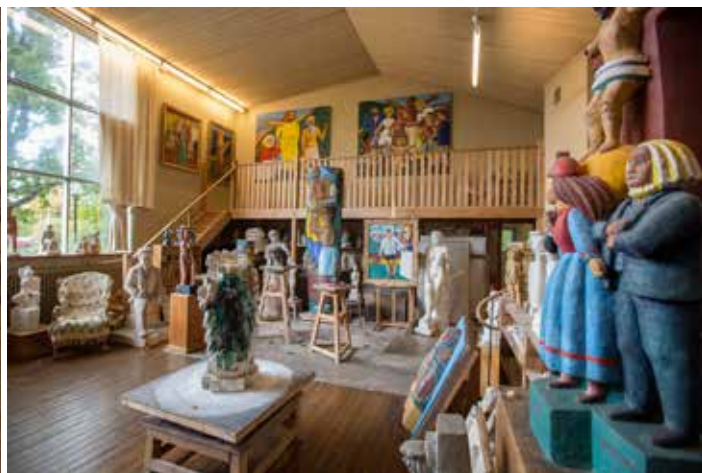
Bror Hjorts hus i Uppsala