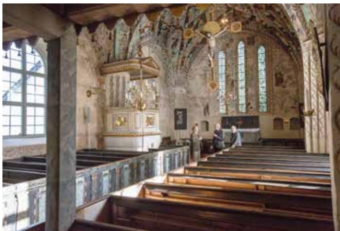
Albertus Pictors fantastiska kyrkmålningar i Härkeberga kyrka