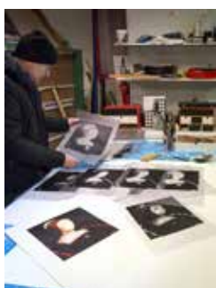
Screentryckeriet Anders Nylén